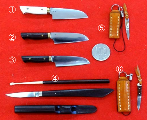
こだわりの一品/ミニシリーズ 柴田明芳作 ①ミニ庖丁象牙柄 L/80mm ¥9,900→¥6,400 ②ミニ庖丁紫檀柄 L/80mm ¥9,350→¥6,000 ③ミニ庖丁黒檀柄 L/80mm ¥9,350→¥6,000 ④デスクナイフ 紫檀スタンド付 ペーパーナイフ/L130mm 耳かき/L120mm ¥13,200→¥8,000 ⑤ミニナイフ L/30mm アパロン ¥8,800→¥5,000 ⑥ミニナイフ L/35mm ウッド ¥8,800→¥5,000