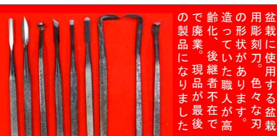
盆裁の彫刻に使用する刃物。色々の刃先が鋭く、現職者が丁寧に仕上げられています。 ①丸刃型 L/195mm ¥6,930→¥4,800 ②笹葉型 L/195mm ¥7,590→¥5,300 ③玉刃型 L/190mm ¥6,930→¥4,800 ④小刀型 L/195mm ¥6,930→¥4,800 ⑤平刃型 L/190mm ¥6,930→¥4,800 ⑥平丸型 L/195mm ¥6,930→¥4,800 ⑦鎌右型 L/195mm ¥6,930→¥4,800 ⑧鎌左型 L/195mm ¥6,930→¥4,800 ⑨剣型 L/180mm ¥6,930→¥4,800

錆の出難いステンレス鋼の刺繍鋏。ドイツ製の刺繍鋏の種類も大分減ってしまいました。