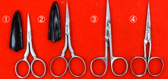
ステンレス鋼 刺繍鋏 ①35-0026 L/90mm ¥7,700→¥5,400 キャップ付 ②40-0026 L/105mm ¥8,800→¥6,200 キャップ付 ③232-447 L/110mm ¥8,250→¥5,800 ④285-4 L/105mm ¥8,250→¥5,800 ①・②はサテン仕上げ ③と④はミラー仕上げ

錆の出難いステンレス鋼の刺繍鋏。ドイツ製の刺繍鋏の種類も大分減ってしまいました。