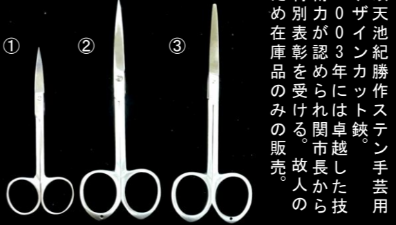
①先尖反り型 L/120mm ¥4,125→¥2,900 ②先尖反り型 L/160mm ¥4,730→¥3,300 ③先丸直型 L/160mm ¥4,620→¥3,200