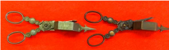
ドイツ製のローソク芯切鋏 切りとった芯はボックスの中で挟んで火を消します。 左/#1197 L/160mm ¥5,280→¥3,700 右/#1198 L/160mm ¥5,280→¥3,700