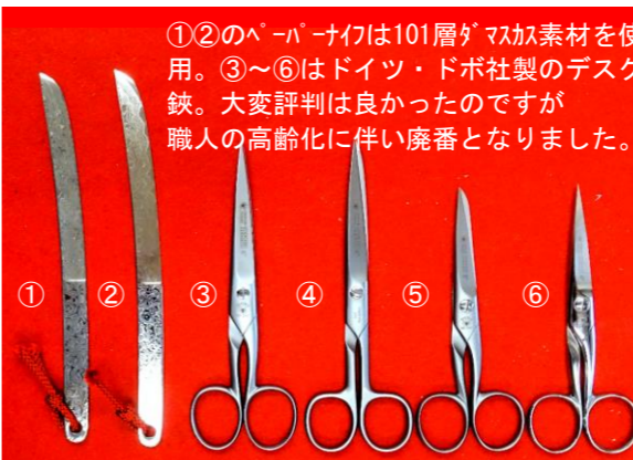
デスク鋏・ペーパーナイフ ①ペーパーナイフ・ブラック L/195mm ¥9,900→¥7,000 ②ペーパーナイフ・シルバー L/195mm ¥8,800→¥6,200 ③デスク鋏285-6SA 先尖 L/155mm ¥8,800→¥6,600 ④デスク鋏295-6SA 細片丸 L/155mm ¥9,460→¥7,000 ⑤デスク鋏285-5SA 片丸 L/130mm ¥8,360→¥6,200 ⑥デスク鋏285-5MI 先尖 L/130mm ¥8,800→¥6,600 SAはサテン仕上げ、MIはミラー仕上げになります