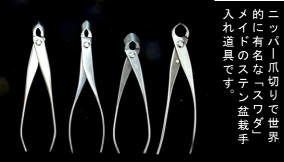
ニッパ爪切りで世界的に有名な「スワダ」メイドのステン盆裁手入れ道具です。 ①エグリ又枝切/小 L/180mm ¥20,900→¥15,500 ②先細又枝切 L/180mm ¥18,920→¥14,100 ③又枝切/小 L/165mm ¥17,160→¥12,800 ④コブ切/小 L/180mm ¥17,160→¥12,800