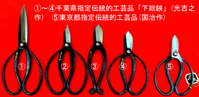
長い歴史を受け継ぐ伝統的工芸品 植木・華道鋏 ①光吉之作 槇の葉鋏 L/235mm ¥33,000→¥25,000 ②光吉之作 大久保鋏 L/180mm ¥22,000→¥16,500 ③光吉之作 華道鋏 池坊型 L/180mm ¥22,000→¥16,500 ④光吉之作 華道鋏 古流型 L/165mm ¥19,800→¥14,800 ⑤国治作 華道鋏 古流型 L/165mm ¥19,800→¥14,800

刃物フルカワ (株)古川商店 260-0013 千葉市中央区中央3-15-12 TEL043-222-3856 FAX043-221-1981 URL http://www.frkw.com/ e-mail/furukawa@frkw.com