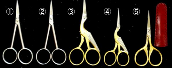
切れ味本位 炭素鋼のシルエット鋏and刺繍鋏 ①シルエット鋏/反り L/105mm ¥6,050→¥4,300 ②シルエット鋏/直 L/105mm ¥5,500→¥3,900 ③鶴型刺繍鋏/L L/115mm ¥8,140→¥5,700 ④鶴型刺繍鋏/S L/95mm ¥7,150→¥5,000 ⑤金足刺繍鋏 L/90mm ¥6,050→¥4,300 キャップ付

影絵切用鋏や刺繍鋏。切れ味本位の錆が出る炭素鋼を使用。残念ながら徐々に廃番になっております。