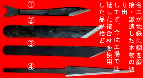
名工の手になる名品切り出し ①三代助丸 鮎 L/165mm ¥22,000→¥20,000 ②三代紋治郎 L/195/24mm ¥11,000→¥8,800 ③三条製作所 末 L/210mm ¥41,800→¥33,000 ④三条製作所 L/255mm ¥39,600→¥31,500 ①故人/三条鍛冶/現代の名工 ②越前鍛冶/伝統工芸士 ③④岩崎重義後継者/水落良市/三条鍛冶 ④繰り小刀(柄・鞘はありません)

文化財再建の和釘を鍛えた 故白鷹幸伯氏の足跡を辿る 刃物フェスタ両日は、2階会場に白鷹幸伯氏の関連資料を展示します。鉄 一千年のロマンを追い続けた